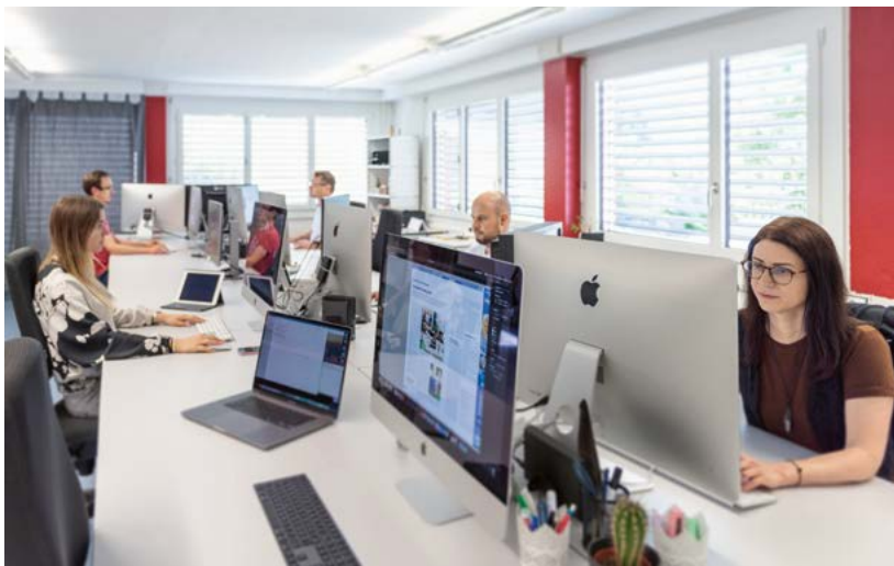
Die Firma – ein grosses Team. Das ist das Ziel der beiden neuen Geschäftsführer.