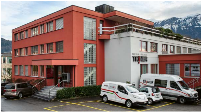
Das Hauptgebäude in Schwyz. Hier sind die Triner Media + Print und der «Bote der Urschweiz» untergebracht.